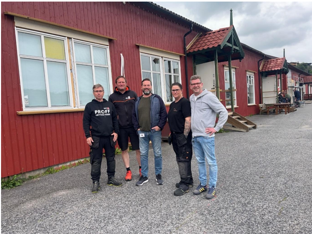
Tiljasnekker'n sammen med Telemark Fylkeskommune og Byggfag opplæringskontoret Telemark.

I august 2025 ble Tiljasnekker'n godkjent opplæringsbedrift for tømmerfaget! Dette er en milepæl i driften av Tiljasnekker'n. Vi tok imot to lærlinger ved Tiljasnekker'n i august. Begge lærlinger jobber i 60 % lærlingstillinger og skal være lærlinger ved Tiljasnekker'n til og med 2028. Dette gir oss mer fleksibilitet og stabilitet enn tidligere år. Vi er heldige som har fått med to dyktige lærlinger på laget!