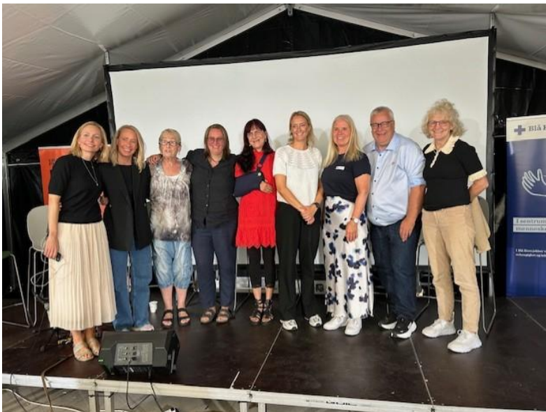
Tiljateateret sammen med politikere og representanter fra KS, Stiftelsen CRUX og Blå Kors

CRUX Tilja jobber for å være synlige både i sosiale medier og i byen vår. Gjennom 2025 har vi fortsatt å øke vår synlighet på Facebook og har en økende gruppe følgere. Tilja-teateret har også i 2025 gitt oss mulighet synliggjøre vårt arbeid på nærmiljøsentre, menigheter, konferanser, og på Grenland Friteater. Vi har også i året som har gått hatt kontakt med politikere på kommunenivå, og arbeider med å synliggjøre vårt arbeid for politisk ledelse. I august var deler av CRUX Tilja teater på Stiftelsen CRUX og Blå Kors sitt arrangement på Arendalsuka med tema «Hvordan sikrer vi oppfølgingstilbud?». Les mer under kapittel Høydepunkter.