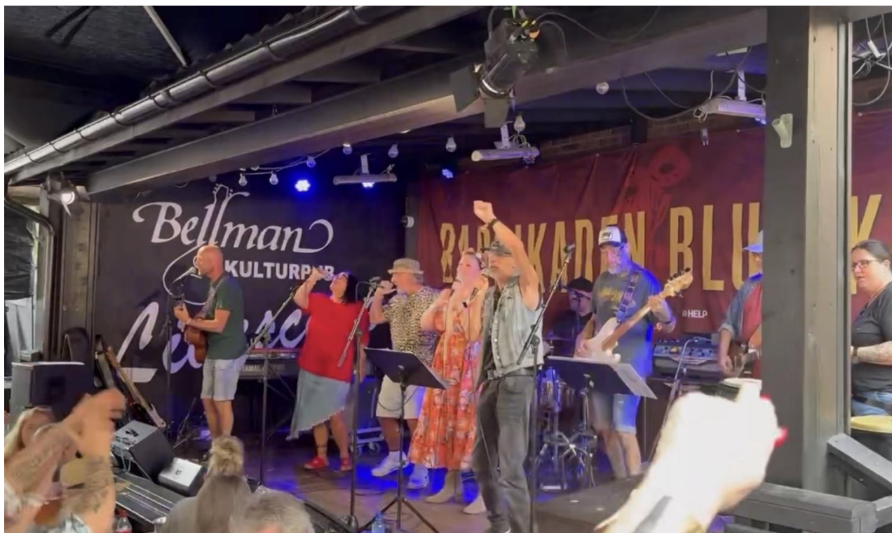
Next level på Notodden Bluesfestival 2025

Over flere år har gjengen på Tilja reist til Notodden Bluesfestival for å høre fengselsband og andre band på Jailhouse scenen. I år var det endelig Tiljabandet Next level sin tur til å stå på scenen! Dette var en stor opplevelse for bandet og noe som gav mersmak! Vi håper å bli invitert tilbake kommende år.