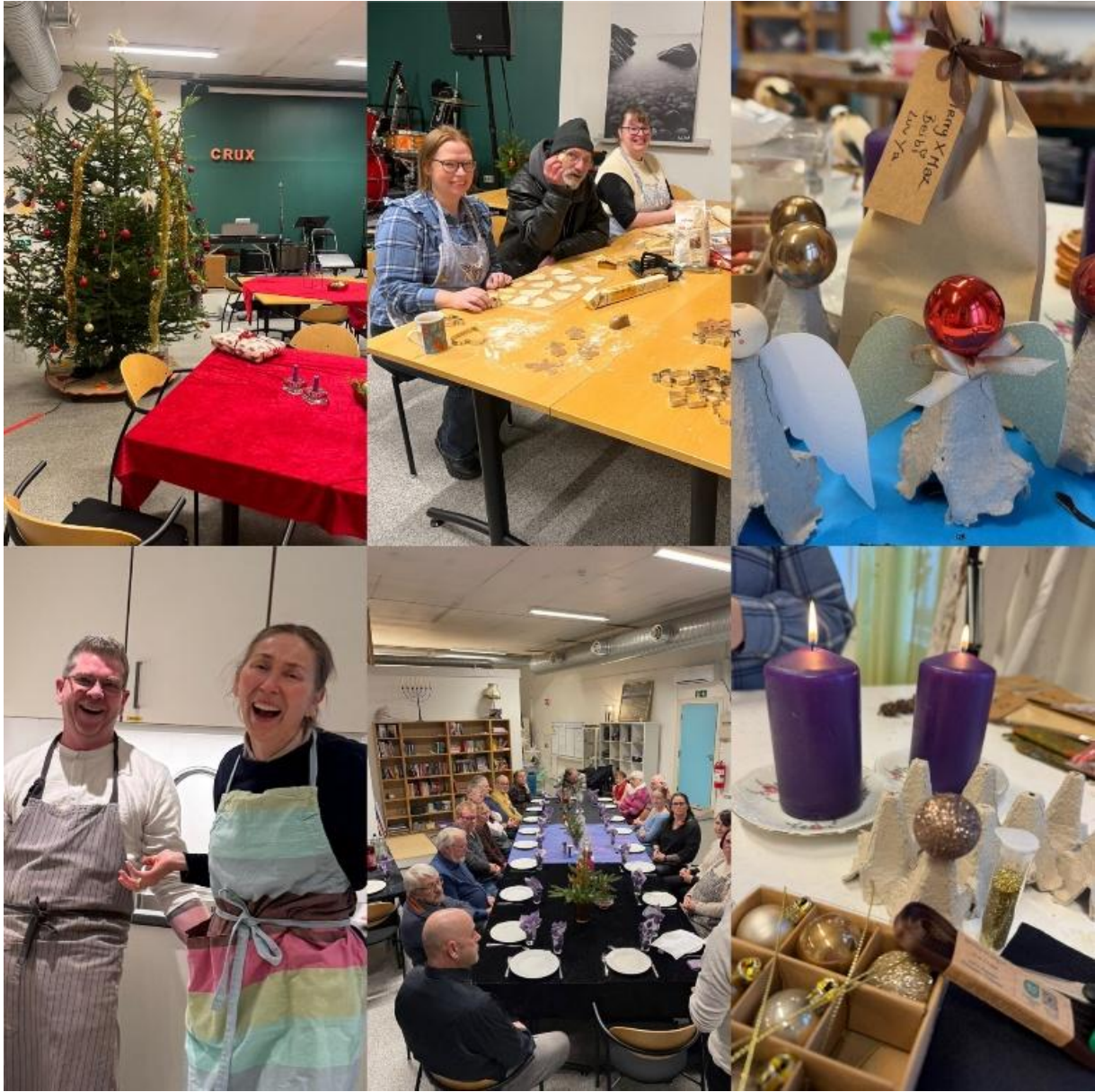
Desember og jul på CRUX Tilja