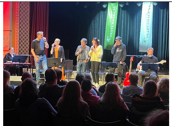
Forestillingen Håp ved Teaterdagene på Lillehammer