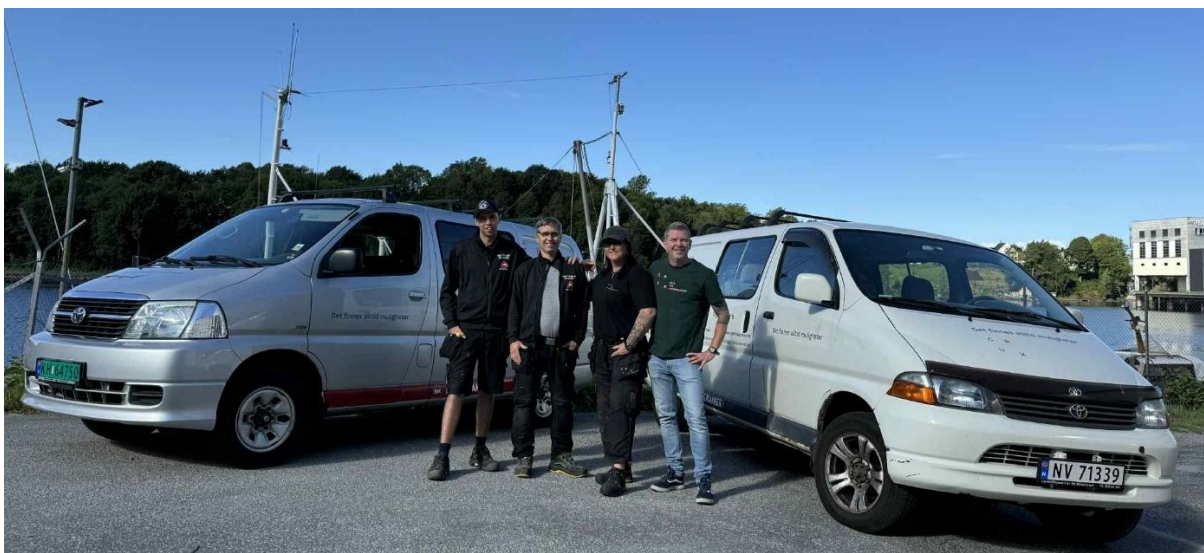
Tiljasnekker'n med arbeidsbiler