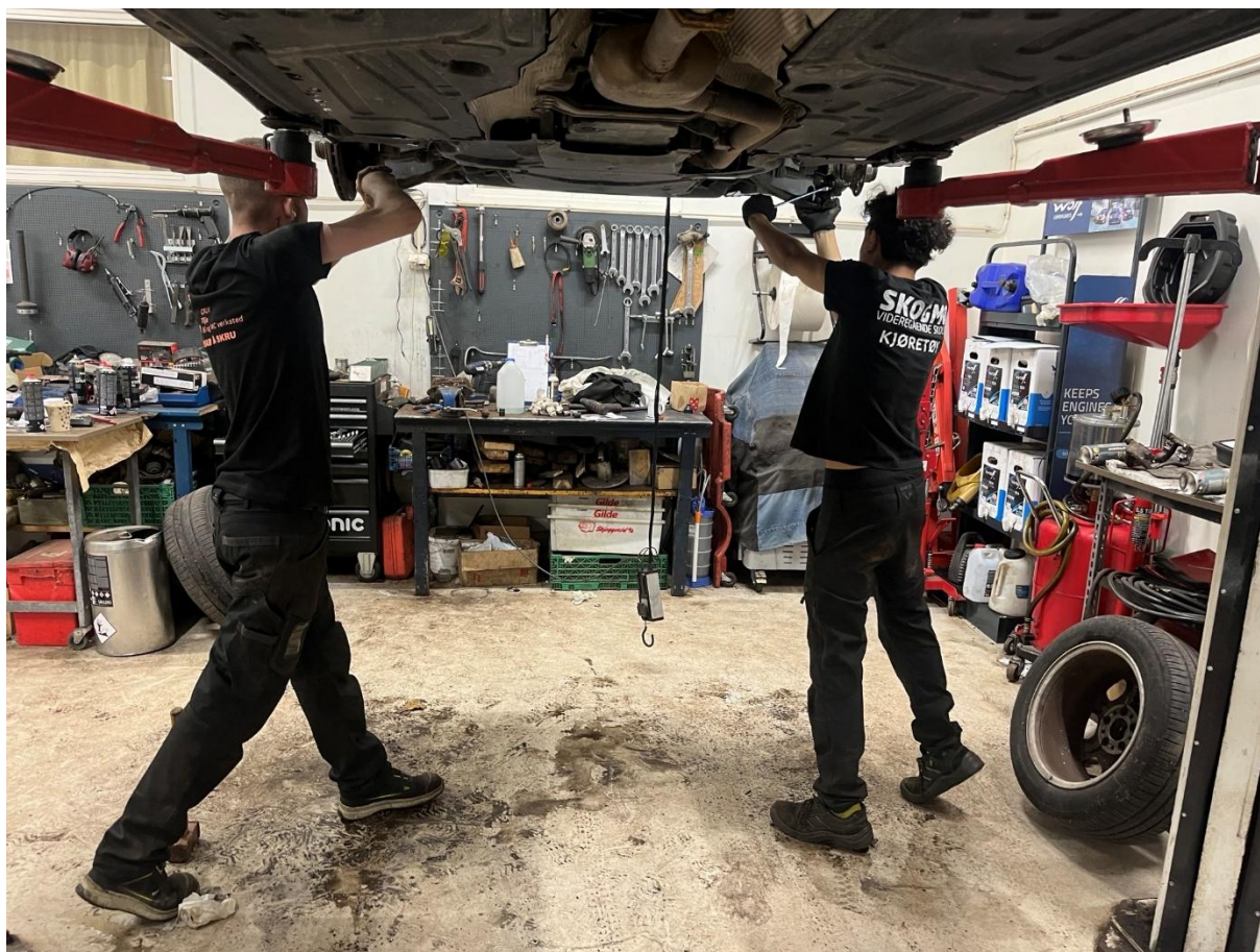
Gutta i arbeidspraksis ved Tilja bil og MC

Det er fremdeles krevende å balansere god arbeidstrening med bærekraftig drift for Tilja bil og MC verksted. Varierende deltakerstabilitet gjør det krevende å drifte økonomisk bærekraftig i et marked med små marginer. Vi er takknemlig for at kundene velger vårt verksted og gir oss muligheten til å gi arbeidspraksis til våre deltakere!