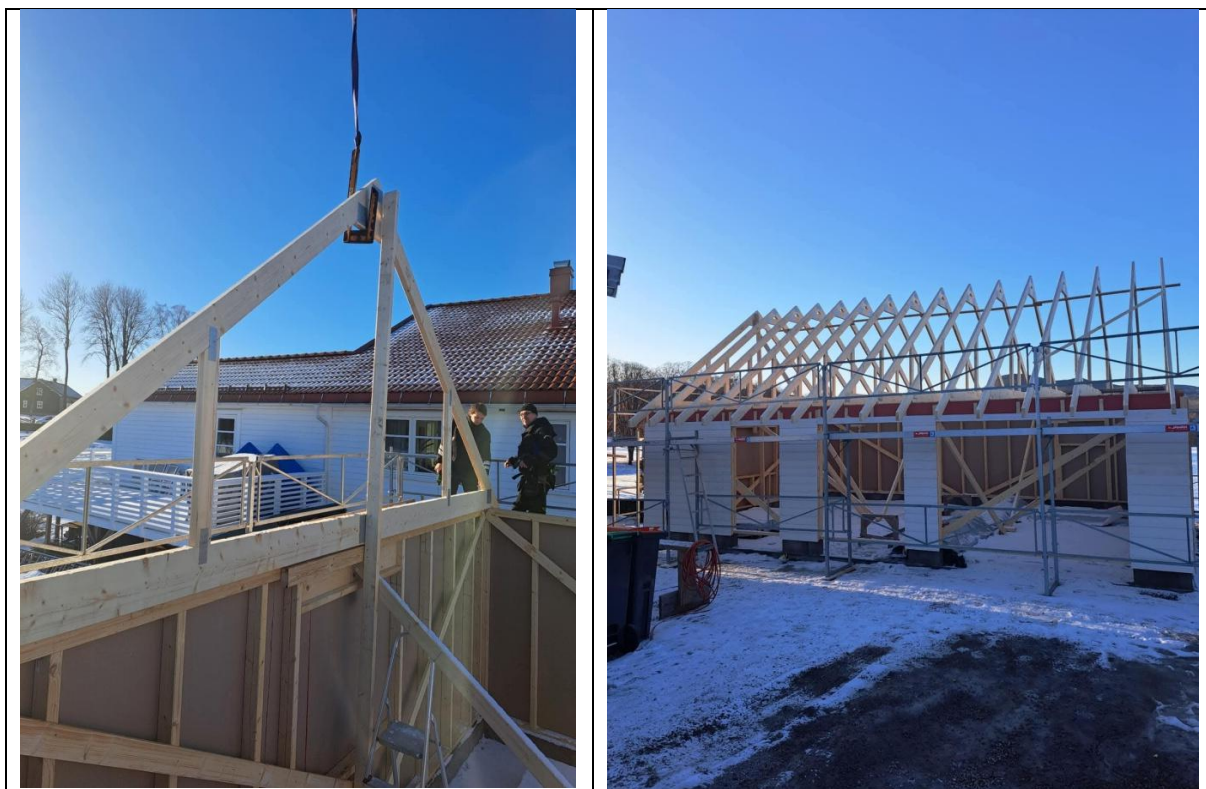
Oppdrag garasje 2025

Situasjonen i tømmermarkedet har bedret seg fra 2024. Vi har i 2025 hatt en bra flyt med oppdrag, og det ser ut til at den positive utviklingen vil fortsette for oss som primært jobber med rehabilitering og ikke nybygg. Vi har fortsatt vårt tette samarbeid med vår leverandør Byggmakker, som gir oss gode priser, forutsigbarhet i drift og tilgang til kurs og kompetansebygging. Økonomisk jobber vi oss nærmere et null resultat og har forventning om at vi i 2026 vil levere vårt første år med positive resultater ved Tiljasnekker'n. I 2025 har vi hatt 5 deltakere og to lærlinger som har vært i aktivitet/arbeidspraksis på Tiljasnekker'n. I løpet av året var det en deltaker som fikk gjennomført fagprøven i tømmerfaget ved Tiljasnekker'n.