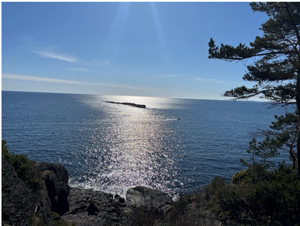
DNT Øitangen, Jomfruland 2025

I august hadde vi vår faste sommerferie til Øitangen på Jomfruland. Vi var 22 deltakere, frivillige og ansatte på Jomfruland sammen! Også i år ble det en fin tur med godt fellesskap, god mat, bading, turer, båt, sol og kubb. Vår faste tur til Øitangen er et høydepunkt i året. Tusen takk til DNT for leie av Øitangen!