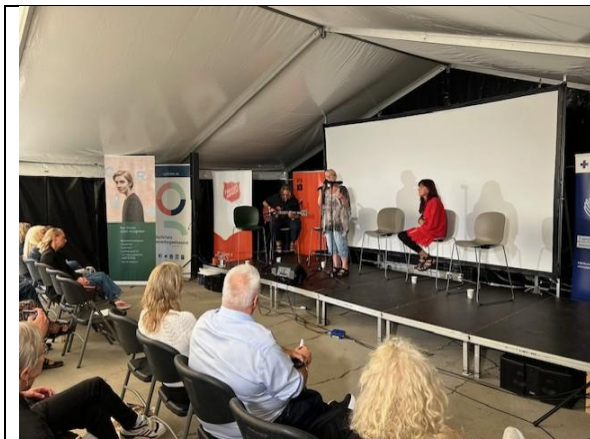
Deler av Tiljateateret på Arendalsuka

Hvert år under Teaterdagene på Lillehammer kåres en eller to vinnere av årets Bøhrre, Amatørteaterets gjevste ildsjelpris! Bøhrre deles ut til pionerer, ildsjeler, politikere eller andre som har betydd mye for amatørteatermiljøet i Norge. Tiljateateret ble nominert til å motta Bøhrre prisen for 2025. Vi havnet på en knepen andreplass, men er takknemlig for at vi ble nominert. Det er en anerkjennelse av arbeidet vi driver med Tiljateateret. Teaterdagene ble holdt 19.-21. september, og vi fikk spille forestillingen «Håp» for festivaldeltakere.